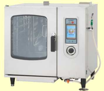
メーカー：(株)コメットカトウ製

国内産初！全自動洗浄機能搭載の 電気スチームコンベクションオーブン “CSWH-EW61”で調理実演を行います！